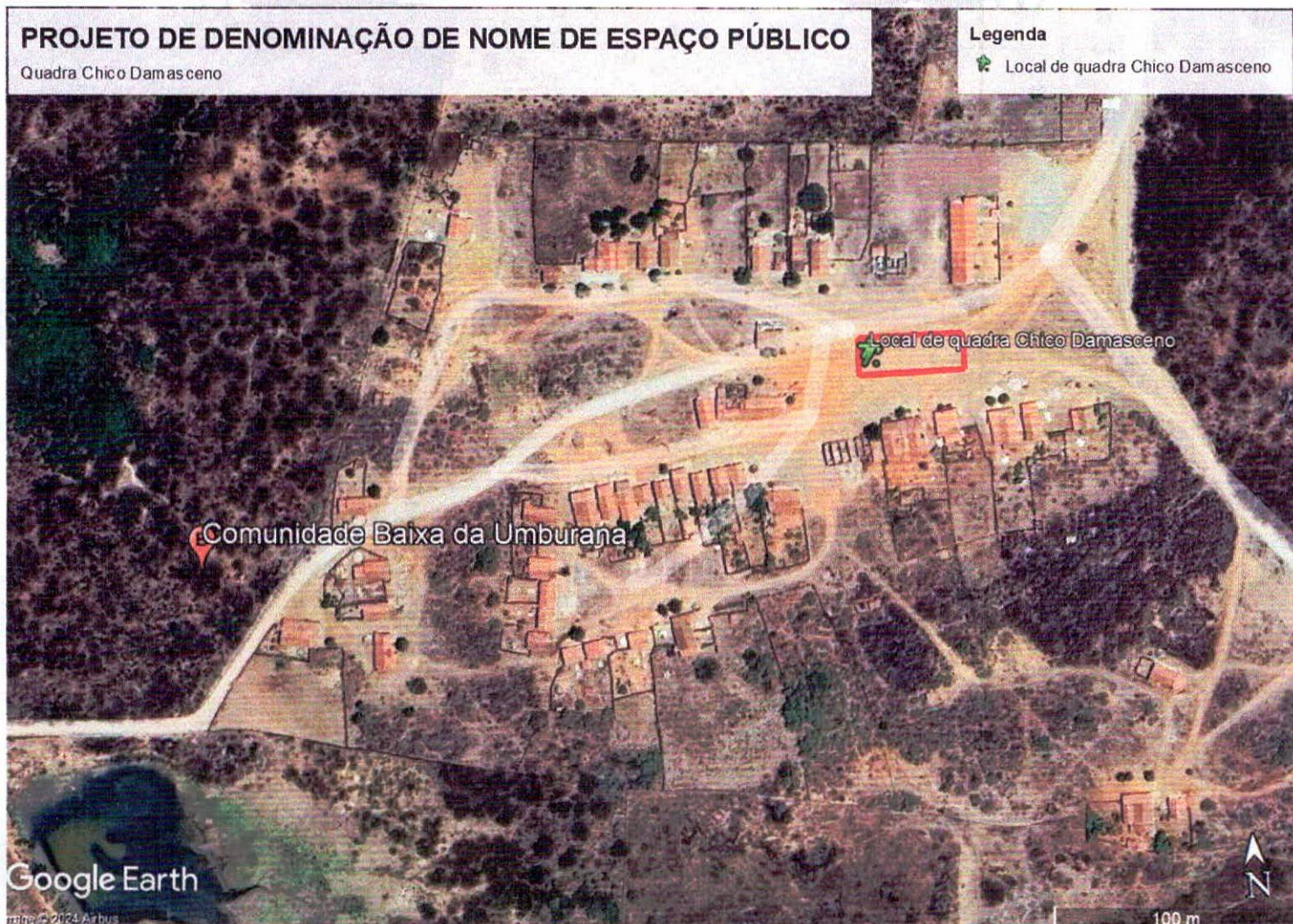
FIGURA 01 – Representação Situacional