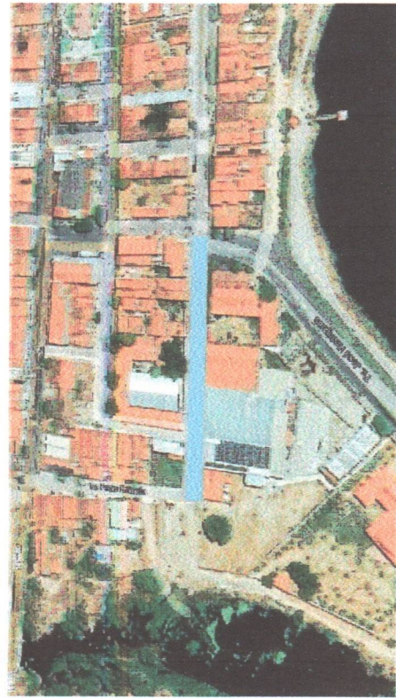
LOCALIZAÇÃO VIA SATELITE